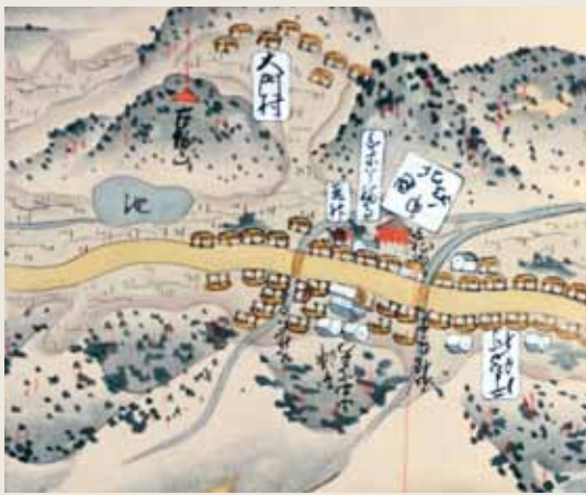
『中国行程記』巻三 片島宿周辺 明和元年 萩博物館蔵