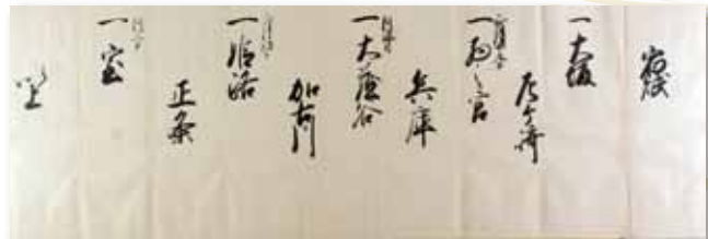
先触 高島家文書 たつの市教育委員会蔵