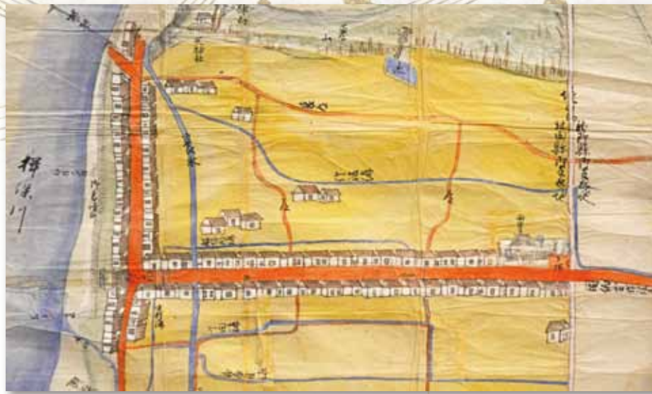
菊崎宿村絵図 明治4(1871)年 東鯨崎自治会蔵

本展では、このようなふるさとの歴史を絵図や宿場町に伝わった資料を通して紹介します。