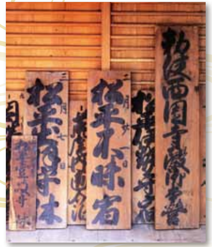
千本宿本陣内海家に伝わる関札 個人蔵