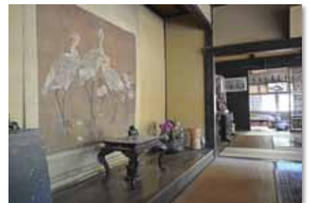
千本内海家住宅(国登録文化財)