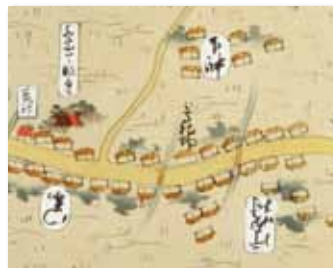
『中国行程記』巻四 片吹村周辺 萩博物館蔵