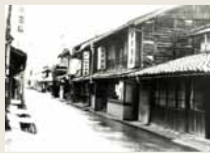
昭和初期の山陽道(上:原村、下:竜野駅前)