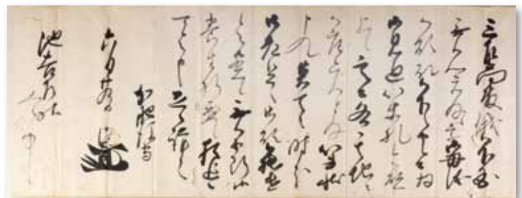
加藤清正書状 6月29日 個人蔵

室津本陣薩摩屋に伝わった加藤清正の書状。輝政の母を気遣う清正の心情を示していると見られる。