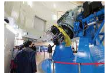
公開望遠鏡として世界最大級 「なゆた望遠鏡」