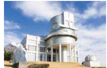
兵庫県立大学 西はりま天文台